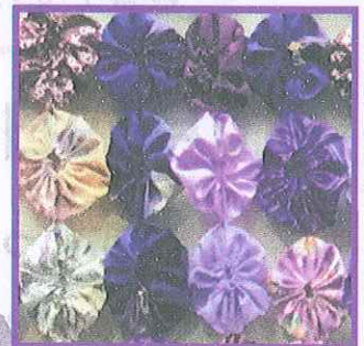
パープルキルトをつないで作品をつくります。