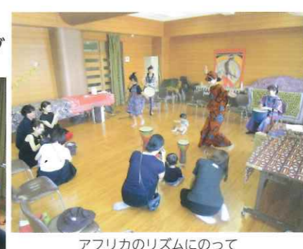
ファミリーコンサート 第2民児協主任児童委員連絡会 日程：8月24日(土) 場所：桜塚小学校多目的教室