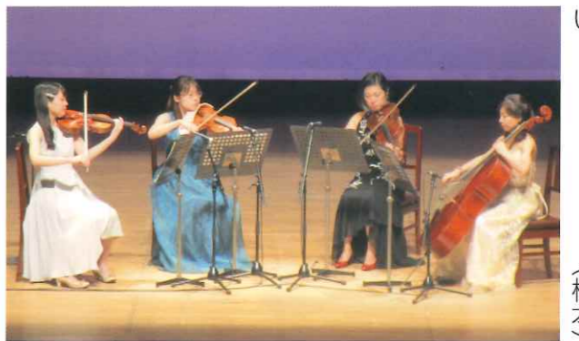
四重奏の音色で「川の流れるように」も、もう一度聞きたい。(橋本)

弦楽四重奏の楽しみは4つの楽器が一つになって奏でるハーモニー。それも、十分に堪能させてもらいました。「情熱大陸」から「川の流れるように」まで。