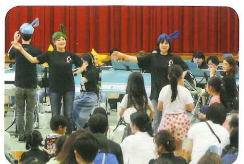
ぽこあぽこの演奏