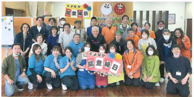
豊中市社会福祉施設連絡会のみなさまと現地へ

会場からボランティアに頼るだけでなく、国がもつと支援する取り組みが必要ではないかという意見も出て、あらゆる機会を通じて声を上げていくことが求められます。