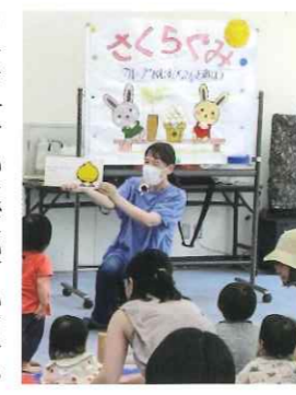
子育てサロン「さくらみ」

桜塚では、福祉会がお弁当を手作りして、今年1月末でお弁当作り千回目を迎えました。毎週水曜日、民生委員と福祉委員で、このお弁当40食を配食しています。ひとり暮らしの方、高齢のご夫婦の方、ご希望があれば介護を担っておられる方等にもお届けしています。お弁当をお届けすることで見守