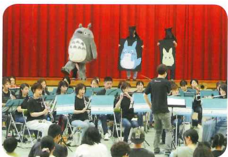
ドトロといっしょに

と踊っている子、演奏者の方へ行こうとする子、それを抑えるママの姿など、微笑ましく感じました。また、主任児童委員の方々の「手遊び」に、皆大喜び！梅雨空も吹き飛ば、爽やかな日曜の午前でした。