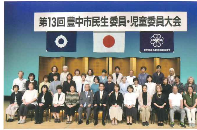
第13回豊中市民生委員・児童委員大会