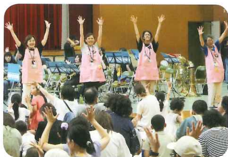
主任児童委員の手遊び

足元の悪いなか、大勢の赤ちゃん、幼児連れの家族が集まりました。オーケストラの演奏に合わせて、ずつ