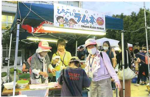
大人気のラムネ販売

刀根山地区のさまざまな催しに、参加協力して民生委員のPRをしています。昨年春の『こどもカーニバル』では、シャボン玉で遊ぼうコーナーとコマ回しのコーナーを出店して、子どもと大人が一緒になって楽しみました。また『TONEYAMA夏フェス』では、ラムネを