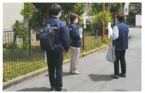
地域ローラー作戦中

北条地区の民生委員は校区の福祉委員会と共に活動しています。 また「ふれあい給食」では、毎回楽しい企画を行います。ゲームをしたり、地域包括支援センターの方に来てもらい、お口の体操をしたり、認知症を聞いたりしました。