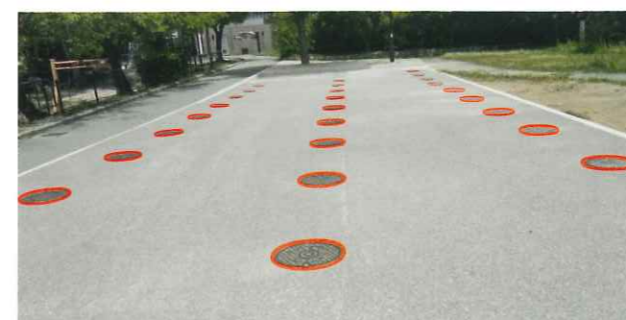
防災トイレ用マンホール(赤丸のところ)