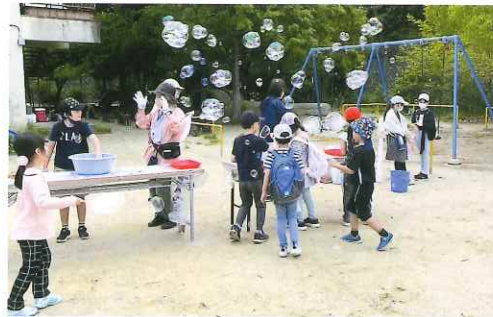
シャボン玉で遊ぼう

販売しましたが、開店と同時に長蛇の列ができ、すぐに完売。楽しみにしていた子どもたち「本当にごめんなさい！」今年の夏フェスではラムネの数を2倍に増やしますので、笑顔も2倍見せてもらいたいですね。これからも委員同士で力を合わせて、ふるさととねやまの人たちが安心して元気に暮らせるよう、微力ながらも頑張つてまいります。