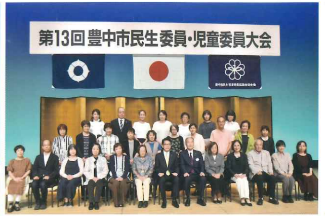
第13回豊中市民生委員・児童委員大会