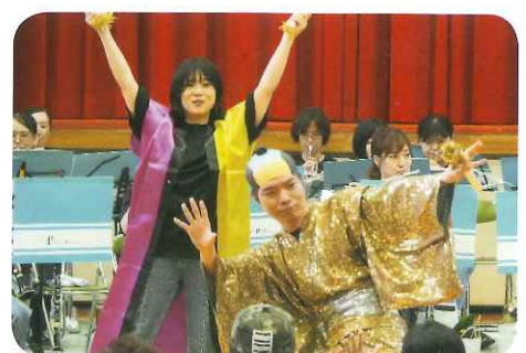
「マツケンサンバ」熱演