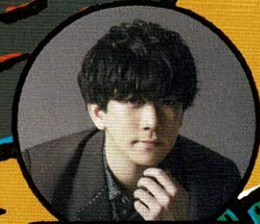
ティラノサウルス 声：伊東健人