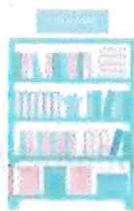
情報ライブラリー