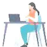
就労支援スペース 「すてっぷα」