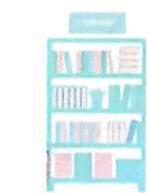
情報ライブラリー