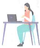
就労をめざすスペース 「すてっぷa」