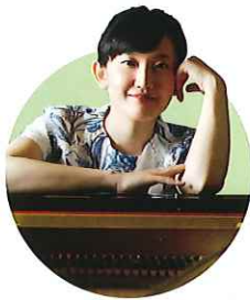
ピアニスト 若井亜妃子