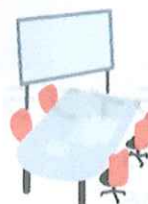
貸ホール 貸会議室