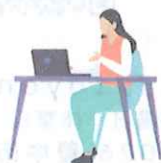
就労をめざすスペース 「すてっぷα」