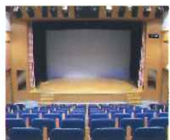
舞台と階段状の客席を備えた小ホール (定員154人)

・定員154人の可動式客席と舞台を備えた小ホールです。 ・マイクなどの音響設備、スクリーンなどを備えます。