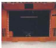
客席を収納するとフラットスペースになります。