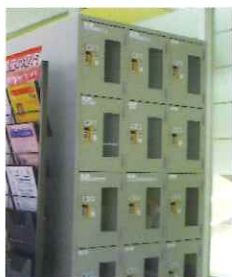
グループロッカー