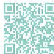
特別貸出申込書 ダウンロードQRコード