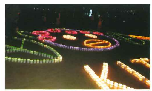
11月4日(土) 北町みんなで楽しむナイト with キャンドルロード