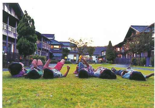
社会福祉法人 舞鶴学園 12月12日 児童養護施設見学Ⅱ