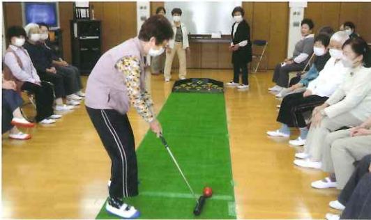
スカットボールで「すかっと!?!」

小曽根地区では筋肉を強化するために、豊中市が考案した「パワーアップ体操」を数ヶ所で行っています。豊中市立南郷の家では毎週40名程度の参加者が集まるので、密にならないように二部制で実施しています。月二回は体操の後で