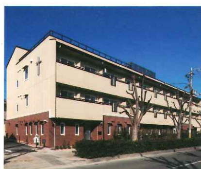
社会福祉法人 大阪水上隣保館 翼 12月4日 児童養護施設見学Ⅰ

豊中市宝山町にあるこの施設は、(社福) 大阪水上隣保館の一施設として平成30年に開設されました。「翼」には、保護者の病気や死亡、あるいは何らかの事情で家庭での養育が困難になり、家庭で生活することが難しい子どもたちが暮らしています。入所している子どもは2歳から高3までと幅広く、少人数(定員6名)で男女に分かれて4つのホームで生活しています。建物も一般の集合住宅のような外観で、内部もアットホームな雰囲気のリビングダイニングと、思い思いに時間を過ごせる子どもたちの居室があります。家庭のようなあたたかさで安心して生活できる空間となりました。お小遣いやお年玉での買い物体験や、スマホ・パソコン・タブレットの使用には一定の制限事項はあるものの、時代に合わせ自立に向けての支援がなされています。社会的養護のもとにある子どもたち